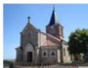
Soleymieux : samedi 2 mars (14h-15h)

Visite d'église assurée par un prêtre de notre paroisse : Pour tous et particulièrement pour ceux qui se préparent au mariage !