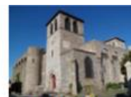
Champdieu : samedi 9 mars (14h-15h) 8